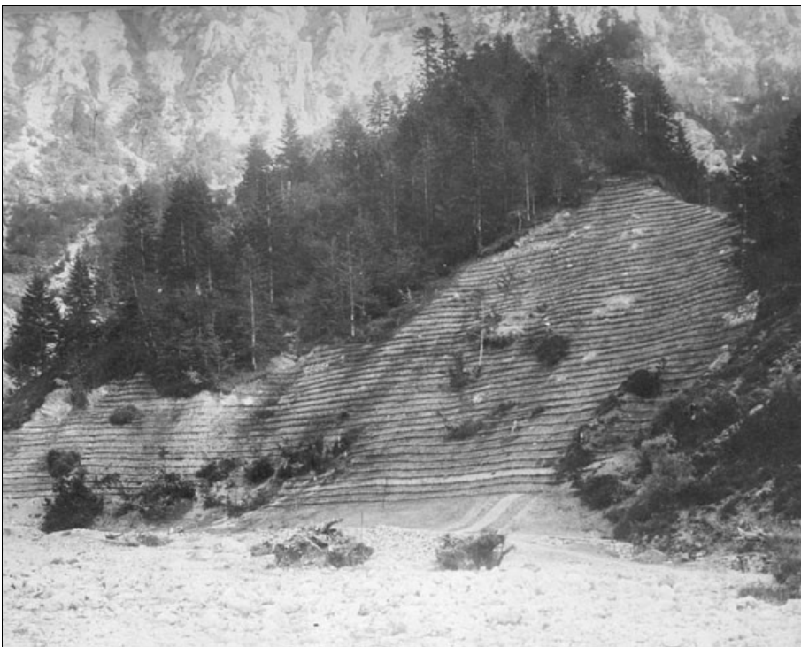
Fig. 4 - Rimboschimento su gradoni.

I lavori si protrassero fino al 1911 e risultarono particolarmente impegnativi a causa dell'asprezza dei luoghi, della natura e franosità del suolo, delle spesso avverse condizioni climatiche, della mancanza di strade e della lontananza dagli abitati.