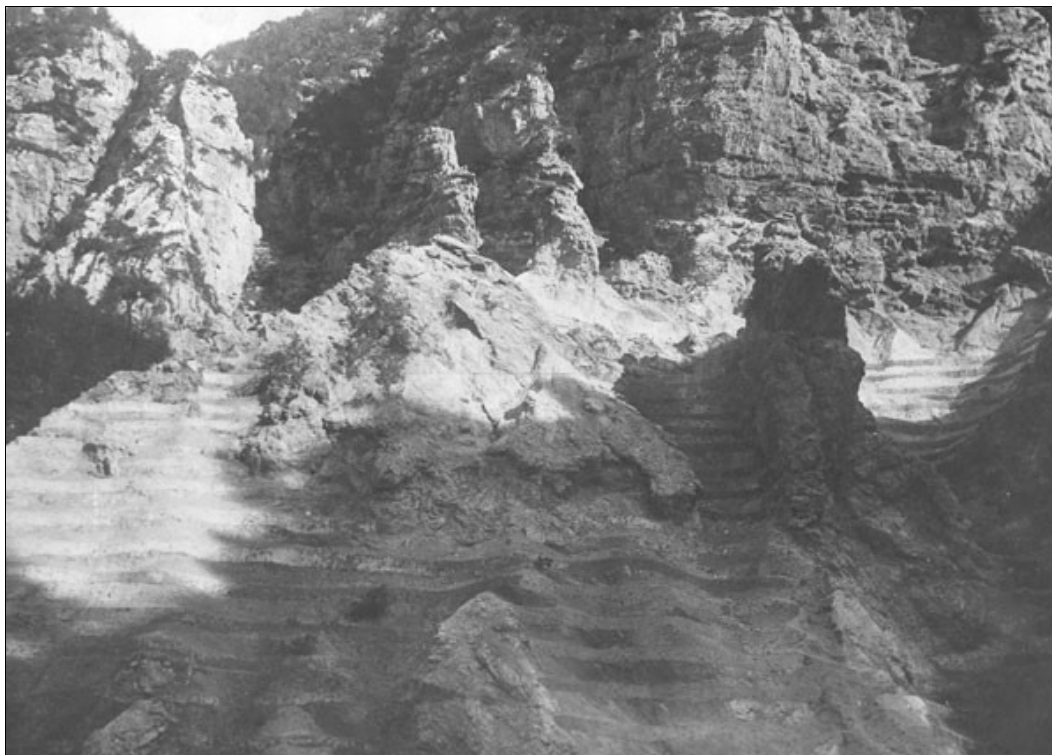
Fig. 2 - I ripidi versanti della Val di Revolto, sistemati a gradoni per il successivo rimboschimento (fonte: archivio fam. Borghetti).

guito a questo evento che nacque l'impegno, da parte dell'allora comitato forestale provinciale, di provvedere alla "bonifica" delle alti bacini montani, attraverso capillari interventi di sistemazione idraulico-forestale.