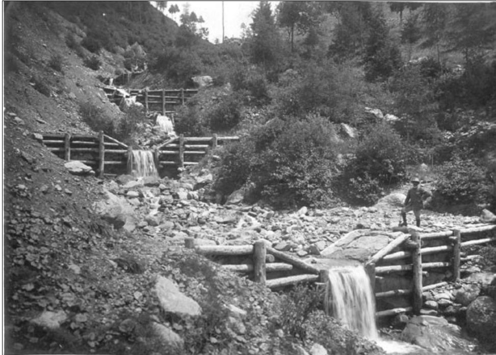
Fig. 1 - Briglie in legno per la sistemazione idraulica dei torrenti (fonte: archivio fam. Borghetti).

Il disordine idrogeologico delle valli veronesi era diventato drammatica priorità ambientale fin dal 1882, anno in cui una grave alluvione, certamente aggravata dal dissesto degli alti versanti, causò vittime e ingenti danni a Verona città. Fu soprattutto in se-