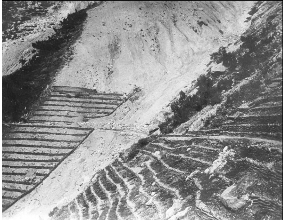
Fig. 3 - Preparazione delle pendici con graticciate.

Primo lungimirante passo fu quello di procedere all'accorpamento amministrativo del bacino; la parte alta del versante, per oltre 600 ettari, ricadeva infatti in territorio austro-ungarico ed era di proprietà del Comune di Ala (Trento). Era questa, peraltro, la parte più interessata dai fenomeni di dissesto e dove più urgeva l'intervento di sistemazione. Il comitato forestale riuscì, fra il 1894 e il 1897, ad acquistare (a caro prezzo, si disse) questa parte di bacino dal Comune